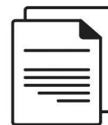
Документ для поддержки

Настоящее Руководство пользователя записано на сам жесткий диск. Рекомендуем создать резервную копию Руководства пользователя на компакт-диске или локальном жестком диске сразу же после подготовки этого диска к работе.