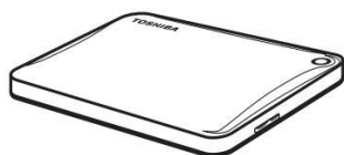
Canvio Ready (с Руководством пользователя и Руководством по безопасной и удобной работе)